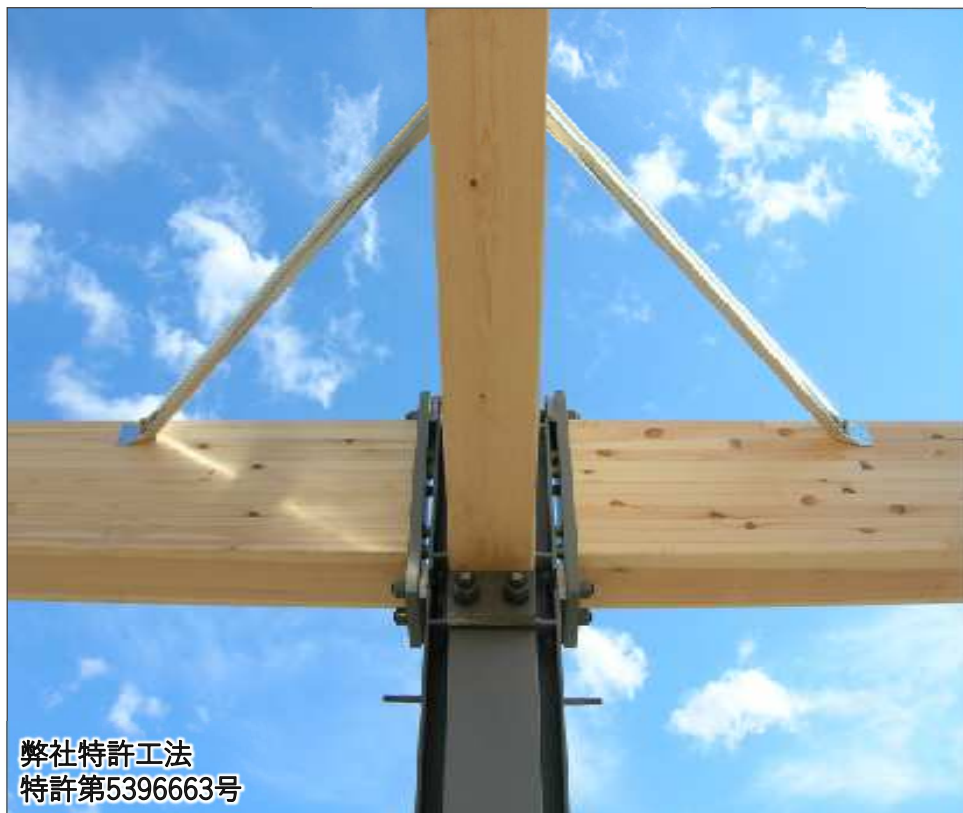
弊社特許工法 特許第5396663号