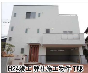
H24竣工 弊社施工物件 T邸

内部空間のレイアウトに自由度が生まれ、子供の成長や家族構成の変化とともに、間取りを変えたりデザインを変えることができます。