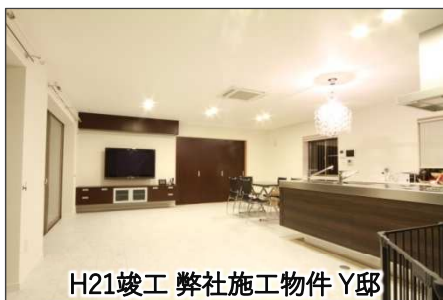
H21竣工 弊社施工物件 Y邸