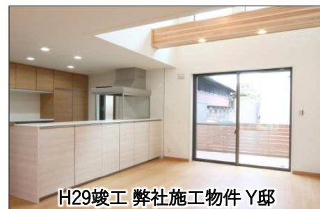
H29竣工 弊社施工物件 Y邸

木造では難しかった1階にビルトインガレージや店舗など多様な空間を演出することができます。高強度・大空間・大開口の住宅づくりが可能となりました。