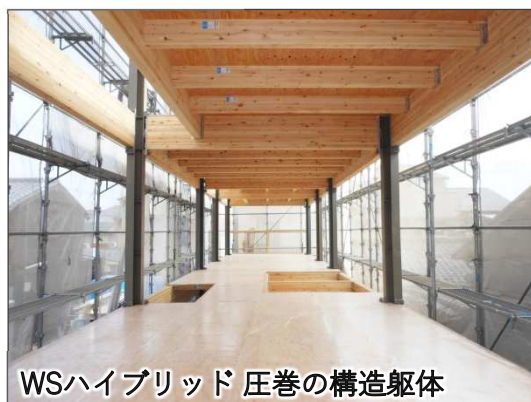
WSハイブリッド 圧巻の構造躯体

木造『Wood』（桁・梁）と、鉄骨『Steel』（柱）を融合させた新工法です。 構造とコストの面で実現が難しかったビルトインガレージや、大開口サッシを 最大間口「6メートル」という設計を実現できます。